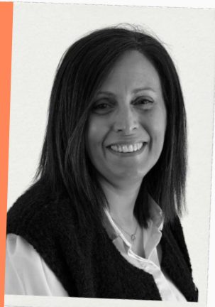
LEÏLA Direction Vie de la structure Contact via l'accueil